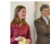
Penerima Penghargaan Cinta Kasih Cemerlang Dunia: Yayasan Bill & Melinda Gates