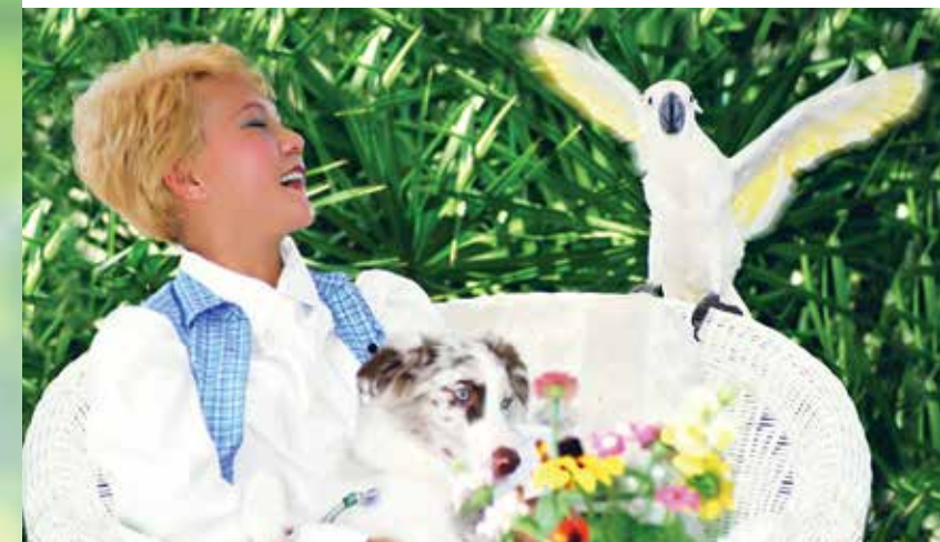
Arsip foto: Florida, AS (2001)

Aktris Inggris pemenang penghargaan Academy Award