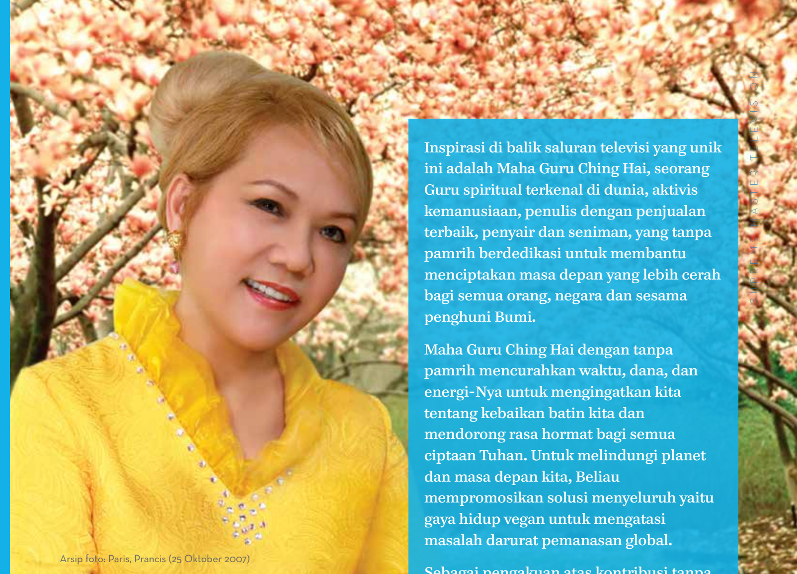
Arsip foto: Paris, Prancis (25 Oktober 2007)

"Supreme Master Television - Saya suka suaranya!"