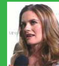
~ Alicia Silverstone Aktris Amerika ( Clueless ); Vegan "Veggie Elite"

Alasan saya menjadi vegetarian adalah karena pada saat menatap anjing saya dan berkata, "Mengapa saya tidak memakanmu? Mengapa saya membuatmu tidur di tempat tidur yang cantik dan memberi begitu banyak cinta untukmu, kemudian makhluk lain yang memiliki hasrat yang sama untuk hidup, memiliki kepribadian yang sama-sama lucu, semua hal yang dapat diberikan anjing Anda untuk Anda - mengapa saya memilih untuk membiarkan hewan ini disiksa?"