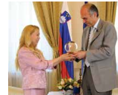
Arsip foto: Maha Guru Ching Hai memberikan Penghargaan Kepemimpinan Cemerlang Dunia kepada Presiden Slovenia Dr. Janez Drnovšek (1950 - 2008) (Vegan)