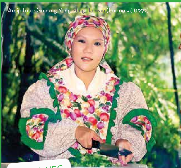
Arsip foto: Gunung Yang Ming, Taiwan (Formosa) (1992)