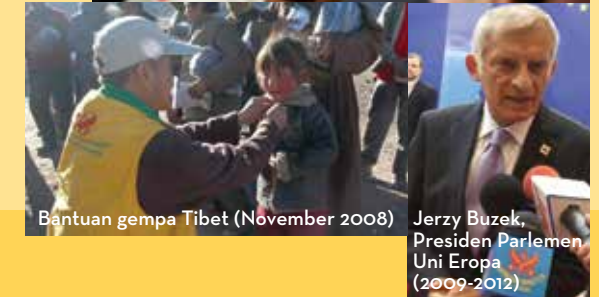
Bantuan gempa Tibet (November 2008) Jerzy Buzek, Presiden Parlemen Uni Eropa (2009-2012)