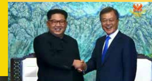
(Kiri) Rekan Terhormat Kim Jong Un Pemimpin Tertinggi Republik Rakyat Demokratik Korea Panglima Tertinggi Tentara Rakyat Korea Ketua Partai Buruh Korea Penerima Penghargaan Pemimpin Cemerlang Dunia untuk Perdamaian (Kanan) Yang Mulia Moon Jae-in Presiden Republik Korea