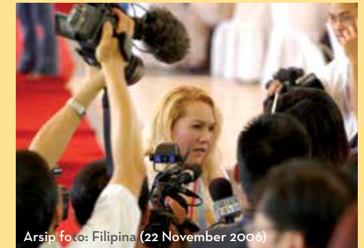
Arsip foto: Filipina (22 November 2006)

Berita Patut Disimak menyajikan berita konstruktif dan mengagungkan perbuatan baik, serta membawa kesadaran akan isu-isu penting di dunia kita. Anggota Asosiasi kami, yang semuanya vegan, adalah para pembawa acara berita dan berasal dari semua lapisan masyarakat serta mewakili budaya yang berbeda di seluruh dunia. Dengan liputan luas tentang topik-topik yang relevan pada zaman kita ini, Berita Patut Disimak adalah inti dari fokus Supreme Master Television untuk acara positif untuk dunia yang damai.