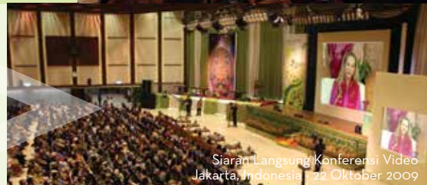
Siaran Langsung Konferensi Video Jakarta, Indonesia 22 Oktober 2009

Menjadi vegan di seluruh dunia adalah kemajuan cinta kasih yang akan mengangkat dan menyatukan semua budaya, membawa ketenangan untuk manusia dan hewan. Kedamaian batin yang datang dari mengganti pembunuhan dengan menghormati semua kehidupan akan menyebar seperti gelombang di seluruh dunia, mengangkat hati manusia, dan menciptakan Surga yang harmonis di Bumi.