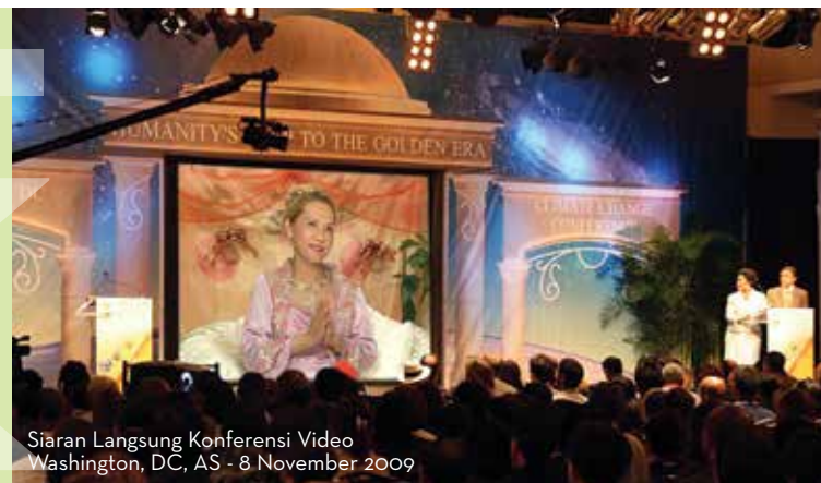
Siaran Langsung Konferensi Video Washington, DC, AS - 8 November 2009