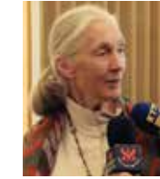
Penerima Penghargaan Cinta Kasih Cemerlang Dunia: Ibu Dr. Jane Goodall