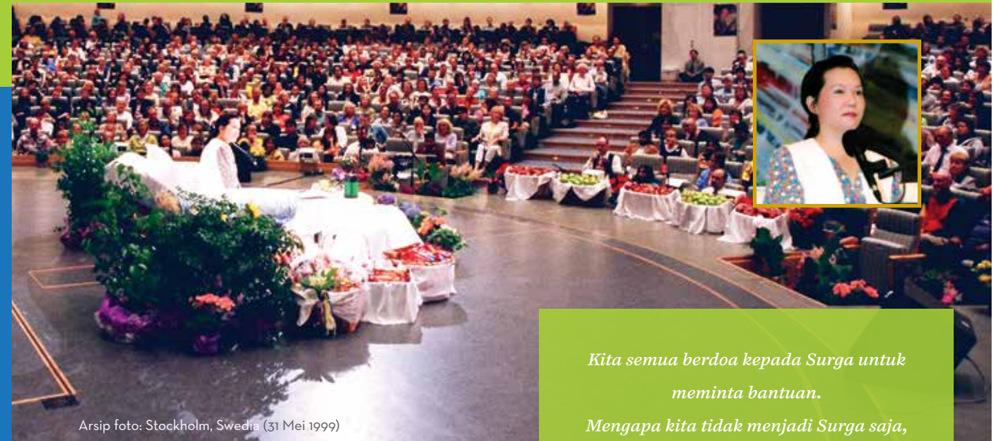
Arsip foto: Stockholm, Swedia (31 Mei 1999)

Program ini juga menawarkan kearifan spiritual Maha Guru Ching Hai yang berharga yang dibagikan selama tur ceramah internasional-Nya selama 30 tahun terakhir yang ditujukan kepada para pencari kebenaran tentang makna kehidupan, kedamaian batin dan tema-tema penting lainnya.